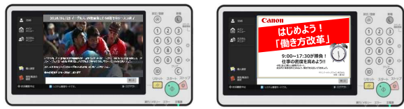
イベント情報を表示