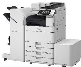
imageRUNNER ADVANCE C5560F II *オプション装着時